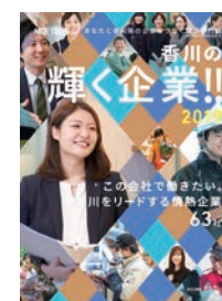
香川の企業をつなぐ就活専門誌「香川の輝く企業」