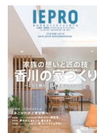
香川で家を作るなら、住宅専門誌「イエプロ」